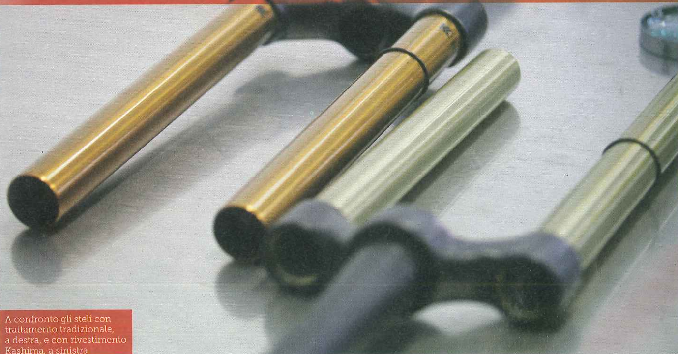
A confronto gli steli con trattamento tradizionale, a destra, e con rivestimento Kashima, a sinistra

OGNI PRODOTTO, SECONDO L'ANNO DI PRODUZIONE O IL LIVELLO, RICHIEDE UNA CORRETTA E PARTICOLARE PROCEDURA DI SMONTAGGIO E RIMONTAGGIO